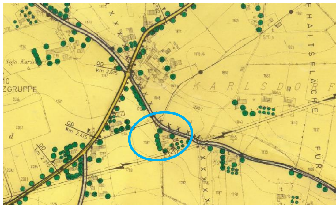
Abbildung: Ausschnitt rechtswirksamer FNP mit blauer Umrandung des Plangebietes

Die Gemeinde Forstern verfügt über einen rechtswirksamen Flächennutzungsplan in der Fassung vom 21.10.1987 mit bisher 13 rechtswirksam gewordenen Änderungen. Der für die vorliegende Flächennutzungsplanänderung gegenständliche Bereich wird darin als Fläche für die Landwirtschaft dargestellt.