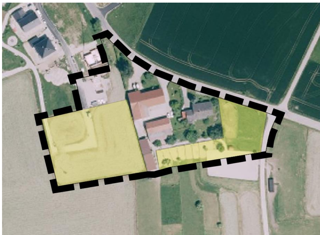
Luftbild des Landesamtes für Digitalisierung, Breitband und Vermessung, DOP 20, 2015

Folgende Abbildung zeigt eine Luftbildaufnahme der Eingriffsfläche (gelb markiert) aus dem Jahr 2015: