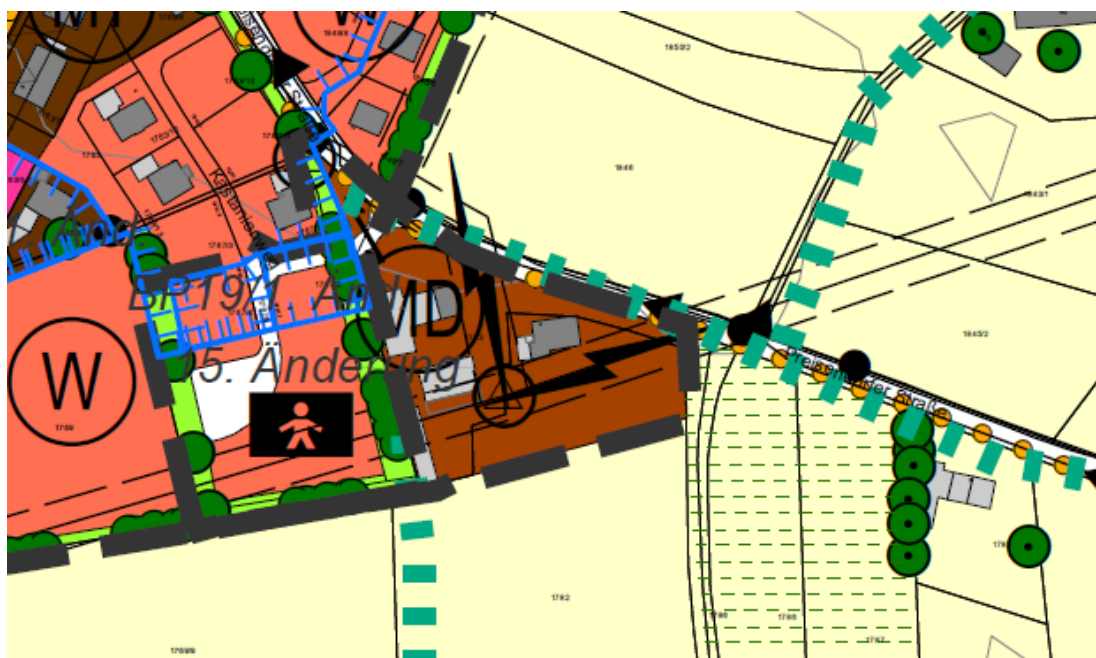
Abbildung: Vorentwurf der 14. Änderung des Flächennutzungsplans mit integriertem landschaftsplanerischem Fachkonzept.

Der Grünstreifen, der gemäß 9. Änderung des Flächennutzungsplans die beiden Teilbereiche (Allgemeines Wohngebiet im Westen und Fläche für die Landwirtschaft mit Hofstelle im Osten) trennt, ist Teil des Grünkorridors Trockental und setzt sich als lineares Element für die Verbesserung von Lebensräumen im Biotopverbund fort. Ein solches Element stellt das Konzept ebenso entlang der Preisendorfer Straße, an welche das Plangebiet im Nordosten grenzt, dar. Westlich des geplanten Dorfgebietes grenzt eine potenziell geeignete Fläche für den Biotopverbund auf Trockenstandorten an.